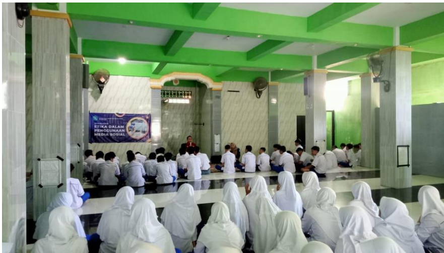
Gambar 2. Kegiatan Pretest

Hasil dari pretest adalah sebanyak 39 siswa atau 51% menyatakan bahwa mereka bebas mengunggah postingan apapun kedalam media sosial sesuai dengan keinginan mereka, karena mereka menganggap media sosial adalah tempat mencari hiburan dengan akses yang sangat mudah. Selanjutnya, hanya sebanyak 18% yang memahami adanya dampak buruk penggunaan media sosial yang berlebihan, sedangkan pemahaman tentang UIITE dalam penggunaan media sosial hanya diketahui oleh 11% siswa.