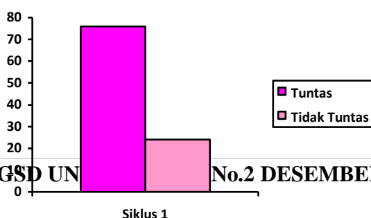
Gambar 4.2 Hasil Belajar siswa Siklus 1