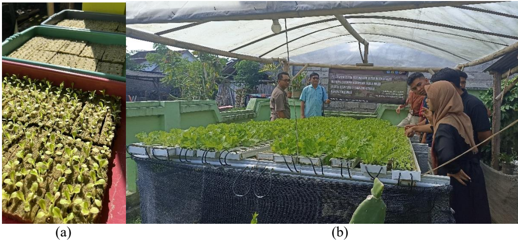
Gambar 3. Aktivitas demonstrasi, (a) hasil perbibitan di nampan oleh petani mitra, (b) tim pengabdian menjelaskan pembagian meja untuk sistem peremajaan.

Tahap akhir kegiatan selanjutnya dilakukan evaluasi. Petani hidroponik selanjutnya mengisi kuesioner yang diberikan oleh tim pengabdian. Hasil evaluasi menunjukkan bahwa sebelum kegiatan sosialisasi 73% peserta belum mengenal maupun memahami sistem peremajaan (Gambar 4a). Hasil ini terjadi karena petani tersebut menggunakan sistem budidaya hidroponik secara manual, sehingga penggunaan lahan budidaya belum dioptimalkan. Keseluruhan lahan digunakan untuk budidaya mulai pembibitan hingga pembesaran. Hal ini tentu dapat membatasi produktivitas selada yang dihasilkan di setiap bulannya.