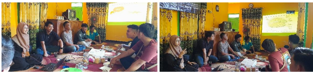
Gambar 2. Kegiatan diskusi pasca sosialisasi

Kegiatan dilanjutkan dengan demonstrasi penerapan sistem peremajaan. Demonstrasi dilakukan memberikan percontohan penerapan sistem peremajaan. Salah satu petani mitra Satriya Agro mempraktikkan teknik persemaian di nampan selama 3 hari hingga menghasilkan bibit muda selada (gambar 3a).