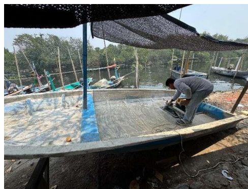
Gambar 3. Persiapan Permukaan Gladak

Setelah pelatihan dilaksanakan terdapat adanya peningkatan pemahaman peserta terhadap materi dibandingkan sebelum pelatihan. Sebagian besar nelayan mampu mengidentifikasi jenis kerusakan FRP dengan benar, serta mampu melakukan pencampuran resin dan katalis dalam proporsi yang tepat dan mengaplikasikannya pada media praktik. Selain itu, seluruh peserta berhasil melakukan proses perbaikan kerusakan permukaan pada sampel panel FRP, seperti retak halus ( crack ) dan delaminasi ringan, sesuai instruksi instruktur. Hasil ini menunjukkan bahwa pelatihan efektif dalam meningkatkan pengetahuan dan keterampilan teknis nelayan dalam perawatan kapal FRP. Proses perawatan dan perbaikan kapal nelayan dalam pelatihan ini dapat dilihat pada gambar 3, 4, 5, dan 6.