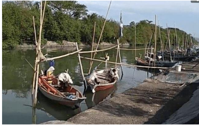
Gambar 2. Karakteristik kapal nelayan Tambak Wedi

Gambar 2 menunjukkan karakteristik umum kapal nelayan Tambak Wedi. Kapal ikan yang digunakan rata-rata berbahan dasar Kayu dengan Panjang berkisar antara 9 – 11 meter, lebar berkisar antara 1,5 m – 2 m. Alat tangkap yang digunakan rata-rata adalah jaring dan pancing.