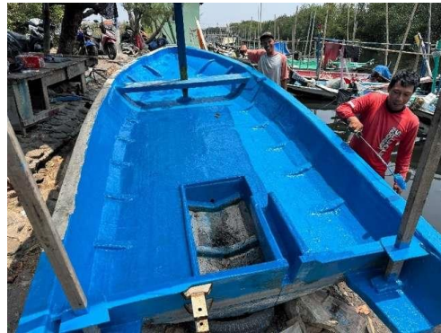
Gambar 5. Proses pelapisan Kapal