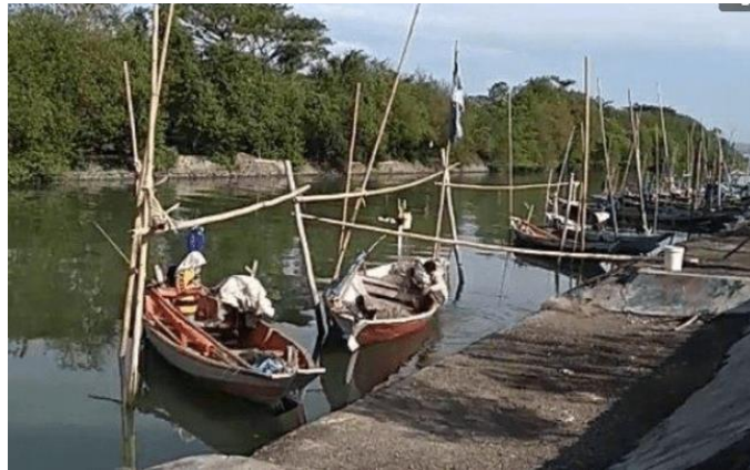
Gambar 2. Karakteristik kapal nelayan Tambak Wedi

Gambar 2 menunjukkan karakteristik umum kapal nelayan Tambak Wedi. Kapal ikan yang digunakan rata-rata berbahan dasar Kayu dengan Panjang berkisar antara 9 – 11 meter, lebar berkisar antara 1,5 m – 2 m. Alat tangkap yang digunakan rata-rata adalah jaring dan pancing.