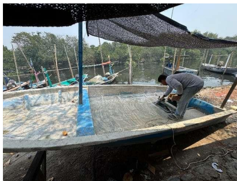
Gambar 3. Persiapan Permukaan Gladak

Setelah pelatihan dilaksanakan terdapat adanya peningkatan pemahaman peserta terhadap materi dibandingkan sebelum pelatihan. Sebagian besar nelayan mampu mengidentifikasi jenis kerusakan FRP dengan benar, serta mampu melakukan pencampuran resin dan katalis dalam proporsi yang tepat dan mengaplikasikannya pada media praktik. Selain itu, seluruh peserta berhasil melakukan proses perbaikan kerusakan permukaan pada sampel panel FRP, seperti retak halus ( crack ) dan delaminasi ringan, sesuai instruksi instruktur. Hasil ini menunjukkan bahwa pelatihan efektif dalam meningkatkan pengetahuan dan keterampilan teknis nelayan dalam perawatan kapal FRP. Proses perawatan dan perbaikan kapal nelayan dalam pelatihan ini dapat dilihat pada gambar 3, 4, 5, dan 6.