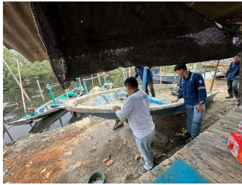
Gambar 4. Persiapan Lambung Kapal