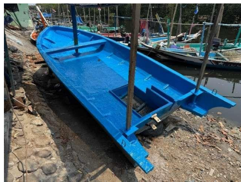
Gambar 6. Hasil akhir pelapisan

Dari sisi manfaat praktis, para nelayan menyatakan bahwa pelatihan ini memberikan nilai tambah terhadap aktivitas operasional perikanan mereka. Dengan kemampuan baru yang dimiliki, nelayan menjadi lebih percaya diri untuk melakukan perawatan preventif dan memperbaiki kerusakan ringan secara mandiri, sehingga dapat mengurangi ketergantungan pada bengkel perbaikan kapal dan menekan biaya perawatan dalam jangka panjang. Selain itu, pemahaman tentang pentingnya perawatan berkala juga semakin meningkat, yang diharapkan dapat