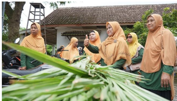
Gambar 3. Pemilihan dan pemilahan bahan baku

Selain peningkatan pengetahuan konseptual, pemetaan partisipatif berperan sebagai instrumen pembelajaran yang memperkuat pemahaman peserta secara kontekstual. Melalui pemetaan, peserta tidak hanya menerima informasi tentang “limbah tumbuhan itu bermanfaat”, tetapi juga memahami bahwa ketersediaan bahan baku di Karangtengah bersifat kontinu dan dekat dengan aktivitas harian (rumah tangga, pekarangan, pemangkasan tanaman, serta aktivitas budidaya). Proses pemetaan mendorong peserta untuk menghubungkan materi dengan realitas: jenis limbah dominan, kapan limbah paling banyak dihasilkan, serta kendala yang selama ini menyebabkan limbah tidak dimanfaatkan. Dalam konteks pembelajaran, tahapan ini penting karena mengubah pemahaman peserta dari level abstrak menjadi “terlihat dan terukur” di lingkungan mereka sendiri. Dengan demikian, peserta memiliki dasar logis untuk melanjutkan ke tahap berikutnya, yakni pemilahan dan persiapan bahan, karena mereka memahami sumber bahan baku dan pentingnya menyiapkan bahan yang layak diolah.