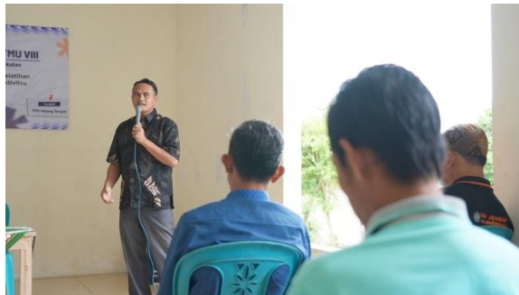
Gambar 1. Sosialisasi materi

Kegiatan pengabdian kepada masyarakat di KWT PRA Karangtengah dilaksanakan pada tanggal 01 Februari 2026 melalui rangkaian sosialisasi yang menekankan peningkatan pengetahuan dan pemahaman peserta tentang pemanfaatan limbah tumbuhan. Alur kegiatan mencakup pre-test , penyampaian materi inti, diskusi kelompok, pemetaan sumber limbah dan kebutuhan komunitas, praktik pemilahan dan persiapan bahan baku, serta post-test sebagai evaluasi akhir. Selama kegiatan berlangsung, peserta terlibat aktif dalam sesi tanya jawab dan diskusi berbasis pengalaman sehari-hari, terutama terkait kebiasaan pengelolaan limbah rumah tangga dan limbah dari pekarangan/pertanian yang selama ini masih didominasi pola buang, menumpuk, atau dibakar. Keterlibatan aktif ini memperkuat proses pembelajaran karena materi sosialisasi langsung dikaitkan dengan konteks lokal dan praktik yang dilakukan peserta.