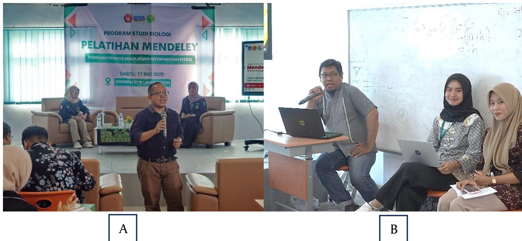
Gambar 1. Pemberian Materi. A) Materi Instalasi Mendeley , dan B) Materi Sitasi Menggunakan Mendeley

Antusiasme peserta terlihat tinggi, mengingat permasalahan manajemen sitasi merupakan kendala umum yang dihadapi mahasiswa. Berdasarkan diskusi, diketahui bahwa sebagian besar mahasiswa sebelumnya menyusun daftar pustaka secara manual, yang rentan terhadap inkonsistensi format dan kesalahan penulisan (Gambar 2).