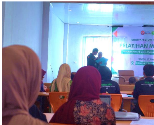
Gambar 2. Antusias Mahasiswa Mengikuti Acara Pelatihan Mendeley

Antusiasme peserta terlihat tinggi, mengingat permasalahan manajemen sitasi merupakan kendala umum yang dihadapi mahasiswa. Berdasarkan diskusi, diketahui bahwa sebagian besar mahasiswa sebelumnya menyusun daftar pustaka secara manual, yang rentan terhadap inkonsistensi format dan kesalahan penulisan (Gambar 2).