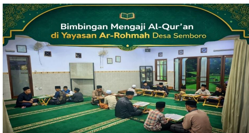
Gambar 3. Kegiatan Pelaksanaan Bimbingan Mengaji Al Qur'an

Untuk menanggapi hambatan yang muncul, penulis menerapkan strategi pembinaan secara bertahap dan bersifat edukatif. Pertama, penulis memberikan teguran dan arahan secara langsung saat anak mulai kehilangan fokus. Teguran disampaikan dengan kalimat yang sederhana, tegas, dan mudah dipahami, kemudian diperkuat dengan pengingat aturan agar anak kembali siap mengikuti bimbingan. Kedua , bagi anak yang sering bercanda dan mengganggu jalannya kegiatan, penulis memberi peringatan disertai konsekuensi yang mendidik. Konsekuensi ini bukan berupa hukuman fisik, melainkan tugas ringan yang melatih tanggung jawab, seperti mengulang hafalan pendek, membaca ulang materi, atau menambah latihan, sehingga anak belajar disiplin dan menghargai proses mengaji. Ketiga , penulis memberikan pendampingan khusus kepada anak yang belum memahami tajwid. Bimbingan dilakukan secara lebih personal melalui pengenalan materi dasar, pemberian contoh bacaan yang sederhana, serta latihan berulang secara bertahap sampai anak mampu mengikuti pembelajaran bersama. Dengan cara ini, kegiatan tetap berjalan untuk seluruh peserta, namun kebutuhan anak yang tertinggal tetap terlayani. Pada akhirnya, hambatan yang terjadi tidak menghentikan program, tetapi menjadi dasar evaluasi untuk memperkuat pengelolaan kelas, meningkatkan kedisiplinan, dan memastikan setiap anak mendapatkan dukungan belajar sesuai kebutuhannya.