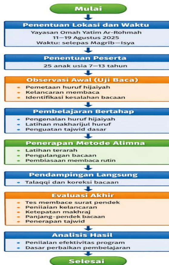
Gambar 1. Alur Metode Pelaksanaan Bimbingan Mengaji Al-Qur'an