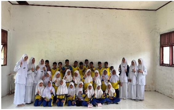
Gambar 1. Lokasi pelaksanaan dengan murid