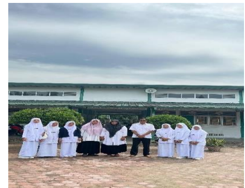
Gambar 4. Foto bersama