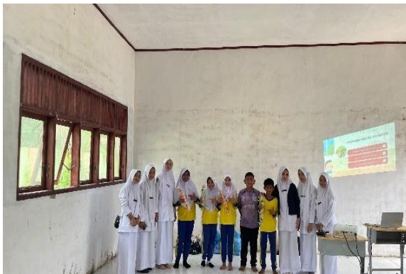
Gambar 3. Foto setelah penyuluhan