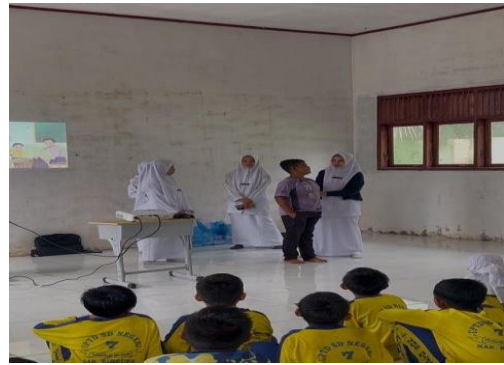
Gambar 2. Penyuluhan