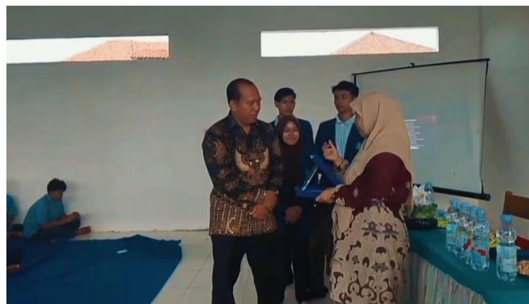
Gambar 2. Penyerahan Cendera Mata Kepada Pihak Sekolah

Kegiatan sosialisasi mengenai pencegahan dan penanganan bullying di MTs Nurul Hikam dilaksanakan dengan melibatkan 150 siswa. Untuk mengukur efektivitas kegiatan tersebut, peneliti membagikan 20 lembar kertas soal sebagai sampel kepada siswa yang dipilih secara acak. Setiap lembar berisi 5 soal uraian yang dirancang untuk mengukur pemahaman siswa mengenai materi sosialisasi, meliputi: