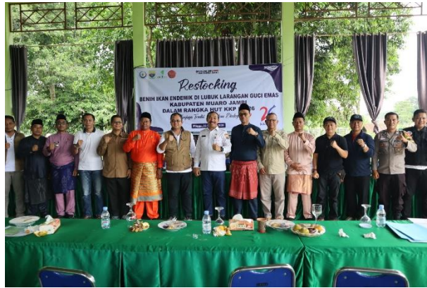
Gambar 5. Launching sistem informasi desa wisata dan restocking bibit ikan

Secara konseptual, kegiatan ini menegaskan bahwa transformasi digital tidak semata bergantung pada ketersediaan teknologi, tetapi juga pada penguatan kapasitas manusia, kelembagaan, dan komitmen terhadap keberlanjutan ekologi. Integrasi sistem informasi desa wisata, media sosial, dan praktik konservasi seperti Lubuk Larangan menciptakan ekosistem pengelolaan pariwisata yang adaptif, berbiaya rendah, dan berkelanjutan. Model ini layak direplikasi di desa wisata lain di Jambi maupun wilayah lain di Indonesia sebagai praktik baik ( best practice ) pengembangan pariwisata berbasis kearifan lokal, pemberdayaan masyarakat, dan konservasi sumber daya alam.