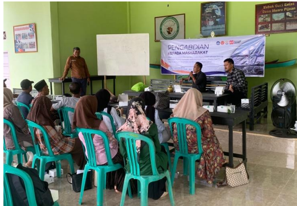
Gambar 2. Focus group discussion (FGD) bersama anggota Pokdarwis

Implementasi sistem ini menjadi bentuk nyata transformasi digital di tingkat komunitas desa. Sebelumnya, seluruh data promosi dan aktivitas wisata masih dikelola secara manual tanpa arsip digital yang terintegrasi. Setelah sistem diterapkan, Pokdarwis kini memiliki basis data daring yang mempermudah pengelolaan konten, komunikasi dengan pengunjung, serta transparansi informasi wisata.