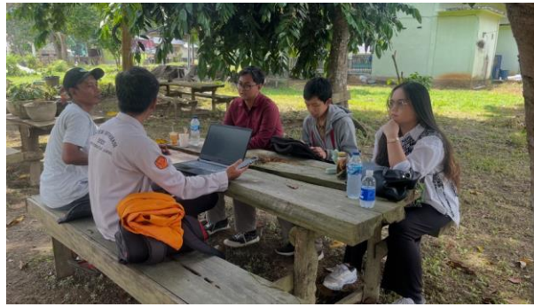
Gambar 3. Diskusi dengan ketua Pokdarwis Guci Emas untuk Pengembangan Media

Hasil pengamatan menunjukkan peningkatan interaksi publik secara signifikan melalui kunjungan laman dan keterlibatan ( engagement ) di media sosial, terutama setelah peluncuran konten video profil dan foto-foto kegiatan adat. Hal ini menunjukkan bahwa pemanfaatan teknologi informasi memiliki dampak langsung terhadap peningkatan visibilitas digital desa wisata serta memperkuat nilai jual destinasi.