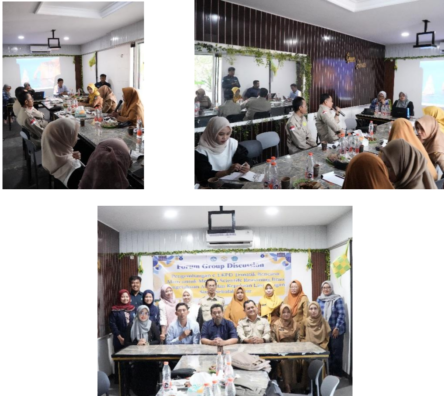
Gambar 2. Pelaksanaan Pendampingan

Tahap observasi dilakukan untuk memantau secara sistematis pelaksanaan pelatihan dan pendampingan pengembangan e-LKPD tematik bencana alam, serta untuk mengidentifikasi respons dan keterlibatan guru selama proses berlangsung. Observasi difokuskan pada beberapa aspek utama, meliputi partisipasi aktif guru dalam kegiatan, kemampuan guru dalam menerapkan tahapan scientific reasoning IPA dalam e-LKPD, serta kualitas interaksi antara tim pelaksana dan guru mitra selama proses pendampingan.