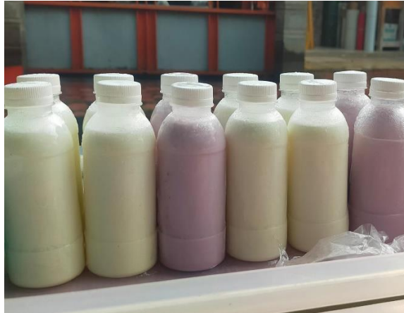
Gambar 2. Kemasan Susu Kambing etawa Sebelum Kegiatan Pengabdian

identitas merek dari produk yaitu sebagai berikut: