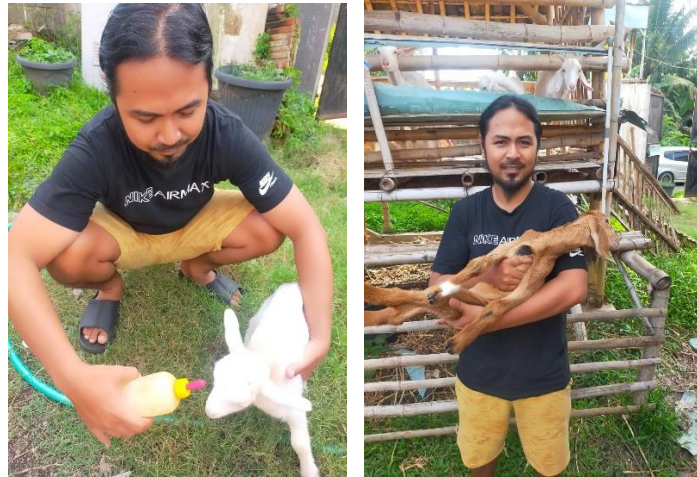
Gambar 4. Pemilik Usaha Susu Kambing etawa

Meskipun kemasan baru ini meningkatkan nilai produk dan daya tarik visualnya, masih ada beberapa hal yang perlu diperbaiki. Salah satu perbaikan yang diusulkan adalah penggabungan cerita khusus pada kemasan untuk menunjukkan bagaimana produksi susu lokal secara alami dilakukan, mulai dari peternakan hingga produk akhir. Untuk mendukung tren pasar global yang semakin peduli terhadap masalah keberlanjutan, bahan kemasan yang lebih ramah lingkungan juga harus dipertimbangkan. Produk ini akan semakin relevan di pasar kontemporer dan ramah lingkungan jika menggunakan bahan kemasan yang biodegradable atau dapat didaur ulang. Secara keseluruhan, upaya ini telah menghasilkan hasil yang signifikan. Selain meningkatkan potensi penjualan, desain kemasan yang kreatif meningkatkan kesadaran merek dan daya saing produk lokal di pasar yang lebih luas. Produk susu Desa Kaliwining dapat terus berkembang dengan evaluasi dan peningkatan berkelanjutan. Ini menjadi contoh sukses dari bagaimana desain dan branding yang efektif dapat mengubah produk lokal menjadi merek yang dikenal luas dan diminati.