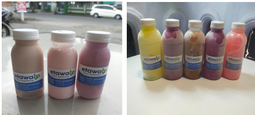
Gambar 3. Kemasan Susu Kambing etawa Setelah Kegiatan Pengabdian

Komponen estetika dalam desain branding meliputi berbagai elemen visual yang menciptakan identitas merek yang unik dan menarik. Elemen-elemen ini mencakup logo, warna, tipografi, gaya visual, dan elemen desain lainnya. Estetika branding yang efektif tidak hanya berfokus pada keindahan visual, tetapi juga pada bagaimana elemen-elemen ini bekerja sama untuk menyampaikan nilai dan kepribadian merek, serta menciptakan pengalaman yang berkesan bagi pembeli. Desain visual modern tidak hanya menunjukkan kualitas produk, tetapi juga membantu pelanggan memiliki persepsi yang baik tentang merek. Aspek keberlanjutan sosial dan ekonomi juga dipertimbangkan dalam kemasan ini. Kemasan dirancang untuk tetap murah tetapi tetap terlihat premium dengan mempertimbangkan daya beli masyarakat lokal. Hal ini memungkinkan produk dijual tidak hanya di Desa Kaliwining tetapi juga di kecamatan, kabupaten, dan pasar provinsi. Dengan langkah ini, pasar produk susu kambing etawa Desa Kaliwining dapat secara signifikan berkembang. Ini akan membuka peluang untuk bekerja sama dengan distributor dan mitra pemasaran eksternal. Tidak hanya desain inisiatif ini yang akan bertahan, tetapi juga pelatihan peternak lokal tentang pentingnya branding , pemasaran, dan manajemen merek. Kegiatan pengabdian ini akan meningkatkan kesadaran peternak akan pentingnya branding , pemasaran, dan manajemen merek dalam jangka pendek dan jangka panjang.