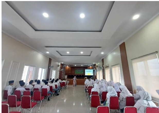
Gambar 2. Penyuluhan “Hadis Nabi Muhammad SAW tentang Etika Lingkungan dan Tanggung Jawab Sosial”

Kedua , relevansi hadis Nabi Muhammad SAW terhadap etika ekologis. Hal ini memiliki peran krusial dalam menumbuhkan kesadaran lingkungan yang dilandasi oleh ajaran dan nilai-nilai keagamaan. Dengan mengaitkan ajaran Islam melalui hadis Nabi Muhammad SAW, siswa tidak hanya memahami pentingnya menjaga alam secara ilmiah, tetapi juga melihatnya sebagai bagian dari tanggung jawab keimanan dan akhlak mulia. Hadis-hadis tentang larangan merusak alam, anjuran menanam pohon, dan menjaga kebersihan menjadi dasar kuat untuk membentuk karakter ekologis yang Islami. Materi ini juga membantu menumbuhkan motivasi internal dalam diri peserta didik agar peduli terhadap krisis iklim, karena mereka merasa bahwa pelestarian lingkungan adalah bagian dari pengamalan ajaran Nabi yang relevan sepanjang zaman.