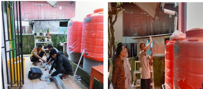
Gambar 2. Pembuatan Alat Dan Edukasi Penggunaan Rapid Sand Filter Serta Perangkat Tadah Air Hujan

Pelaksanaan demonstrasi dan pelatihan dilakukan secara partisipatif di halaman Kantor Kelurahan Barombong. Peserta terlibat aktif dalam proses pembuatan alat, pemasangan sistem tadah air hujan, serta penyusunan sistem perpipaan sederhana. Hasil observasi menunjukkan antusiasme yang tinggi dari peserta, terutama dalam praktik penggunaan alat dan pemeliharaan filter. Evaluasi lapangan seminggu setelah pelatihan menunjukkan bahwa masyarakat telah mampu mengoperasikan alat secara mandiri serta memahami pentingnya menjaga kebersihan wadah dan komponen penyaringan. Keberhasilan kegiatan ini juga ditunjang oleh dukungan dari pihak kelurahan, guru sekolah dasar, kader sanitasi, serta petugas Puskesmas Barombong, yang memperkuat kolaborasi lintas sektor.