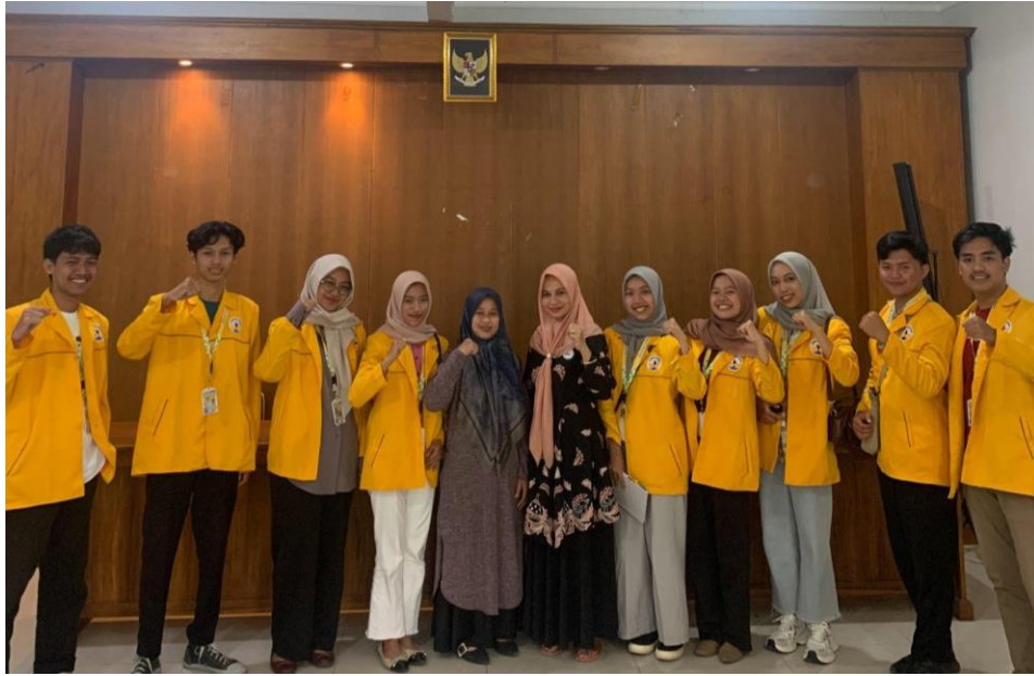
Gambar 1. Diskusi dengan Kader Posyandu Desa Banjaragung.

Tahap persiapan dan perizinan dalam kegiatan ini adalah pembuatan konsep sosialisasi. Berdasarkan hasil survei dan diskusi yang telah dilakukan sebelumnya, konsep sosialisasi yang akan dilakukan ialah dengan memberikan pengetahuan dan pemahaman mengenai gizi seimbang. Dalam metode ABCD, tahapan ini termasuk dalam tahapan design yakni merancang langkah-langkah perwujudan menuju perubahan atau memformulasikan strategi perubahan. Untuk sosialisasi yang akan dilakukan, Kelompok KKN Universitas Tidar mempersiapkan materi mengenai gizi seimbang yakni “10 Pesan Pedoman Gizi Seimbang” dan “Isi Piringku” dengan menyesuaikan pedoman Badan Kependudukan dan Keluarga Berencana Nasional (BKKBN). Materi yang akan disampaikan, disajikan dengan pembuatan media mading seperti yang terlihat pada Gambar 2. Pemanfaatan media mading dilakukan dengan tujuan agar informasi mengenai gizi seimbang dapat disampaikan secara efektif dan menarik sehingga dapat mendorong perubahan perilaku masyarakat dalam memenuhi kebutuhan gizi anak dan dalam pencegahan terjadinya stunting pada anak.