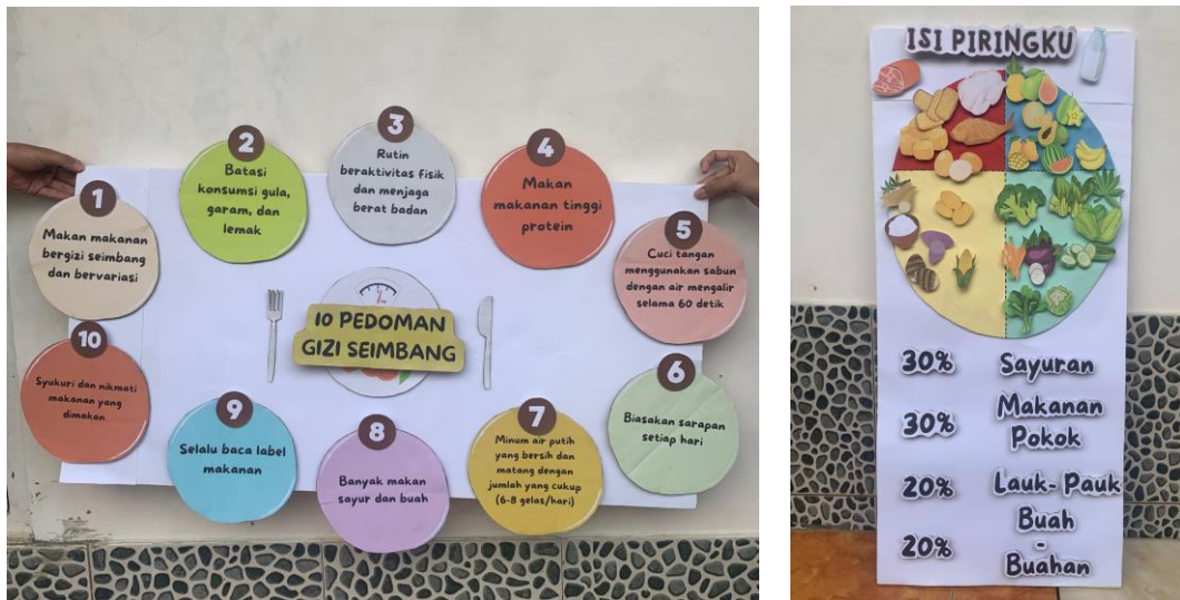
Gambar 2. Pembuatan Media Mading untuk Sosialisasi Gizi Seimbang

untuk melakukan sosialisasi dengan bertepatan pada pelaksanaan kegiatan pemeriksaan rutin Posyandu.