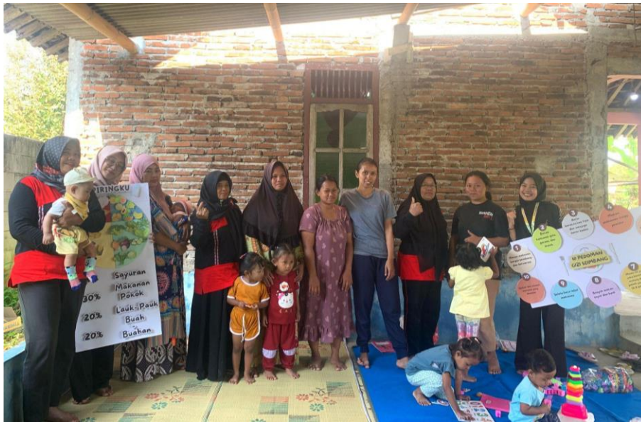
Gambar 3. Sosialisasi Gizi Seimbang di Posyandu Dusun Merjoyo