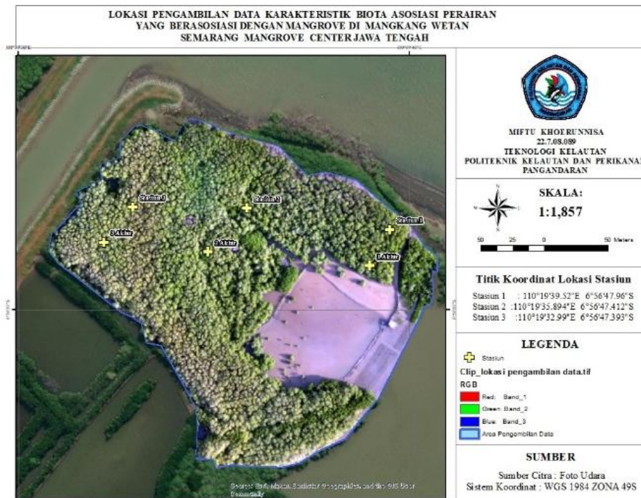
Gambar 1. Lokasi Pengambilan Data Penelitian yang Menunjukkan Titik-titik Stasiun Pengamatan di Wilayah Mangkang Wetan, Kota Semarang

Pengambilan data biota perairan yang berasosiasi dengan mangrove dilakukan menggunakan Visual Encounter Survey (VES) dengan bantuan kuadran pada masing-masing plot berukuran 10 \times 10 meter. Biota yang dijumpai dicatat, diamati, dan apabila memungkinkan diambil sampelnya untuk difoto dan diidentifikasi lebih lanjut. Pengamatan jenis substrat dilakukan langsung pada lokasi dengan mencatat karakteristik sedimen yang mendominasi di setiap titik.