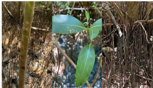
Gambar 3. Identifikasi Morfologi Avicennia marina yang Meliputi Batang, Daun, dan Sistem Perakaran sebagai Ciri Utama dalam Penentuan Spesies Mangrove

spesies pionir yang mampu tumbuh pada berbagai kondisi substrat (lumpur, pasir, maupun campuran), toleran terhadap kisaran salinitas luas, serta tahan terhadap paparan ombak dan fluktuasi pasang surut. Selain sebagai penyusun vegetasi utama, Avicennia marina berperan penting dalam stabilisasi sedimen melalui sistem akar napas yang rapat, sehingga membantu memperkuat struktur lahan pesisir dan mempercepat proses akresi. Serasah daun Avicennia marina juga menjadi sumber bahan organik yang mendorong produktivitas primer dan mendukung keberadaan biota dasar seperti gastropoda dan makrozoobentos [15].