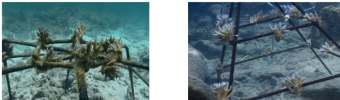
Gambar 2. Dokumentasi kondisi media transplantasi karang model web spider dan model pyramid dan fragmen karang Acropora tenuis pada monitoring minggu ke-11

Ketahanan struktur media transplantasi menunjukkan laju korosif rangka pada kedua model cukup rendah, hal ini diduga karena struktur besi telah dilapisi dengan resin sehingga meminimalisir pertumbuhan alga ataupun lumut. Pada minggu ke -3 terdeteksi adanya pertumbuhan lumut/alga di kerangka besi, namun kondisi fragmen karang terpantau baik dan sehat. Selain monitoring dilakukan juga pembersihan rangka besi dari alga yang menempel menggunakan sikat. Pada monitoring minggu ke-9 alga pada model web spider terdapat satu karang Acropora tenuis yang mati dengan warna kecoklatan dan ditumbuhi alga sementara karang pada media pyramid tidak ada karang yang mati hanya saja terdapat posisi karang yang bergeser posisinya. Berdasarkan monitoring selama 11 minggu diperoleh tingkat kelangsungan hidup karang di transplantasi model pyramid sebesar 100 % sementara pada model web spider sebesar 93%. Kondisi media transplantasi karang model web spider dan model pyramid dapat dilihat di Gambar 2 .