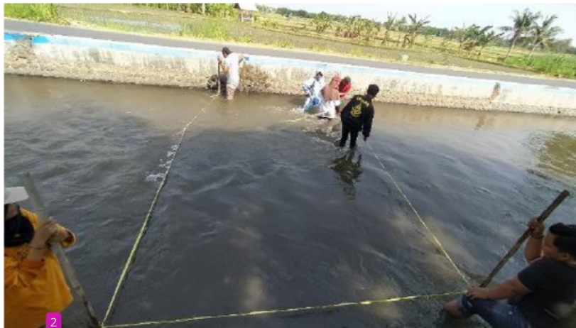
Gambar 1. Lokasi Pengukuran Debit Air Sungai Sumberkolak Maklum

Metode penelitian ini dirancang untuk mengembangkan model matematika yang dapat memprediksi debit aliran Sungai Sumberkolak berdasarkan rata-rata tinggi air sungai dan kecepatan aliran. [1] Pendekatan penelitian menggunakan metode kuantitatif dengan pengumpulan data primer melalui pengukuran langsung di lapangan.