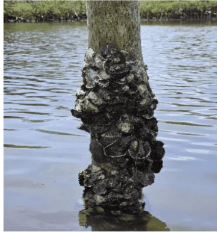
Gambar 3.2 Biota Penempel Pada Bambu

2 Serupa dengan L. scabra , S. cucullata , Clibanarius ambonensis , dan Cardisoma carnifex , umumnya ditemukan di wilayah vegetasi mangrove di sepanjang pantai Indo-Pasifik [4]. Saccostrea cucullata menempel kuat pada tempat pendaratannya seperti mangrove yaitu pada akarnya.