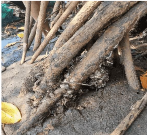
Gambar 3. 1 Biota Penempel

Berdasarkan hasil dari identifikasi biota penempel yang ditemukan di mangrove Muara Kalimalang, kelompok biota penempel yang ditemukan dapat digolongkan menjadi dua, yaitu moluska dan krustasea. Hasil pengamatan di lokasi ini ditemukan biota yang menempel pada batang pohon mangrove dan bambu.