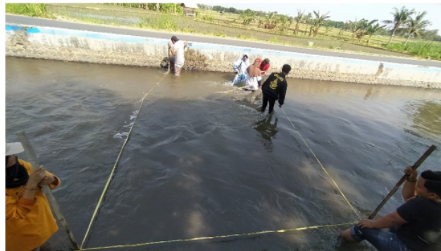
Gambar 1. Lokasi Pengukuran Debit Air Sungai Sumberkolak Maklum

Adapun pembagian area yang diukur ditampilkan pada gambar berikut :