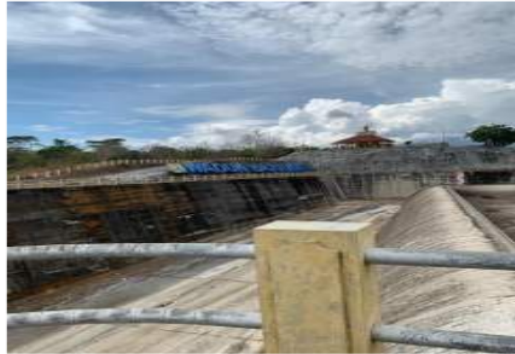
Gambar 1. Waduk Bajul Mati

Waduk Bajul Mati memiliki tipe urugan centre core rock fill dam dengan tinggi 56,80 meter, Panjang 250 meter dan lebar puncak 6 meter. Memiliki kapasitas total 10 juta m 2 dengan luas genangan waduk sebesar 91,93 ha dan volume efektif sebesar 7,4 juta m 3 .