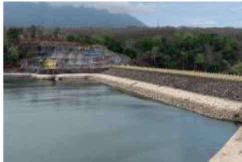
Gambar 3. Tembok Bendungan Waduk Bajul Mati