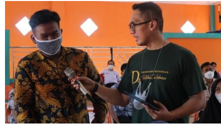
Gambar 9 & 10. Peserta Aktif Mengikuti Diskusi dan Konsultasi