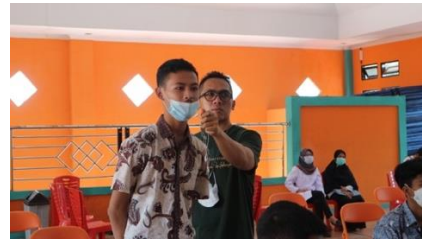
Gambar 11 & 12. Peserta Aktif Mengikuti Diskusi dan Konsultasi

Setelah diskusi dan konsultasi, maka acara ditutup dengan foto Bersama antara panitia PKM, Pemateri, serta seluruh peserta sosialisasi. Kegiatan foto bersama tetap mengikuti protokol kesehatan dengan selalu menjaga jarak dan menggunakan masker. Gambar foto Bersama dapat dilihat dibawah ini: