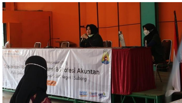
Gambar 8. Pemateri Mempresentasikan Materi Sosialisasi