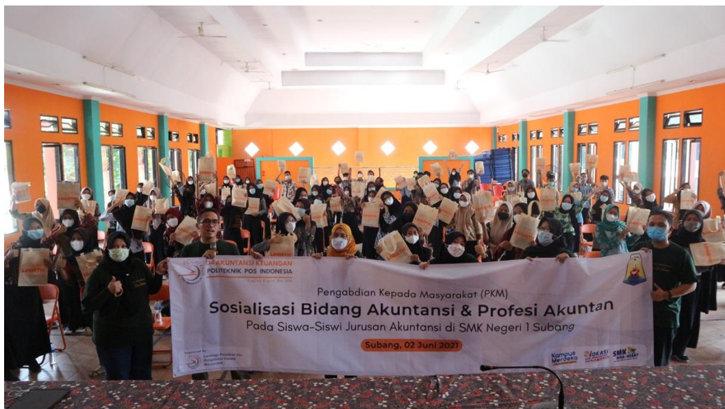
Gambar 13. Foto Bersama antara panitia PKM, Pemateri dan seluruh Peserta

Setelah diskusi dan konsultasi, maka acara ditutup dengan foto Bersama antara panitia PKM, Pemateri, serta seluruh peserta sosialisasi. Kegiatan foto bersama tetap mengikuti protokol kesehatan dengan selalu menjaga jarak dan menggunakan masker. Gambar foto Bersama dapat dilihat dibawah ini: