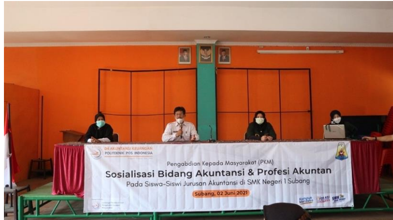
Gambar 4. Sambutan Wakasek Kurikulum SMKN 1 Subang