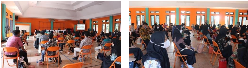
Gambar 6 & 7. Peserta Sosialisasi mengikuti acara secara tertib

Setelah pemaparan materi dari ketiga pemateri, dilakukan diskusi dan konsultasi yang dipimpin oleh tim pengabdian. Diskusi dan konsultasi ini terbuka untuk semua topik dibidang Akuntansi dan profesi Akuntan yang ingin diketahui oleh para peserta sosialisasi. Sesi diskusi dan konsultasi berjalan cukup aktif, pertanyaan yang diajukan cukup banyak dari para peserta. Rasa keingintahuan siswa cukup tinggi, hal tersebut tercermin dari banyaknya pertanyaan mengenai proseppek karir Akuntan. Materi tersebut di SMK memang belum menjadi materi utama, namun sudah dipelajari secara garis besar. Gambar kegiatan sosialisasi dapat dilihat pada gambar dibawah ini: