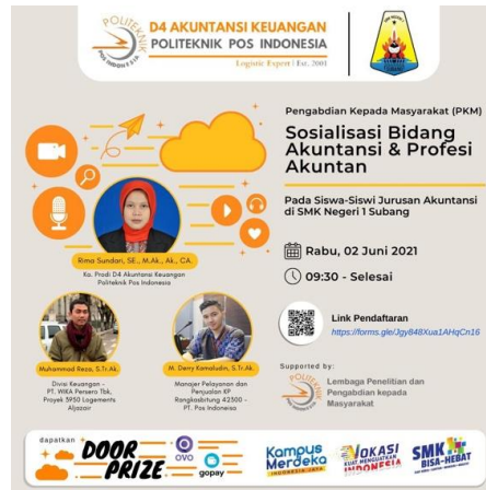
Gambar 3. Undangan Kegiatan PKM

Metode yang digunakan dalam melaksanakan kegiatan Pengabdian Kepada Masyarakat adalah melalui sosialisasi/ceramah. Langkah awal yang akan dilakukan adalah mengadakan peninjauan awal dan mohon izin kepada Kepala Sekolah SMKN 1 Subang bahwa akan melaksanakan kegiatan Sosialisasi Bidang Akuntansi dan Profesi Akuntan pada Siswa-siswi Jurusan Akuntansi. Kemudian mengirimkan undangan kepada para siswa siswi jurusan akuntansi di SMKN 1 Subang untuk mengikuti acara Sosialisasi. Setelah itu Tim PKM memberikan Slide materi untuk bahan bacaan bagi para peserta berkaitan dengan topik sosialisasi. Kemudian melaksanakan sosialisasi yang diberikan oleh narasumber yang kompeten di bidangnya. Kegiatan diakhiri dengan diskusi dan konsultasi.