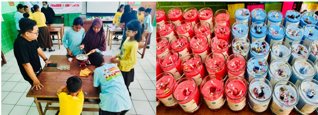
Gambar 4. Praktik Pembuatan dan Produk Hasil Lilin Aromaterapi

Pada tahap pelatihan praktik, para fasilitator mendemonstrasikan cara membuat lilin aromaterapi menggunakan bahan-bahan lokal secara bertahap dan sistematis. Siswa diberi kesempatan untuk berlatih secara berkelompok, mulai dari memasukkan bahan, mencampur, menuangkan ke dalam cetakan, hingga menyelesaikan produk dengan aroma pilihan mereka. Selama pelatihan, lebih dari 90% peserta menunjukkan keterampilan yang baik dalam mengikuti instruksi dan berhasil menghasilkan lilin aromaterapi berkualitas. Observasi lapangan menunjukkan peningkatan kepercayaan diri dan kerja sama antar siswa, serta peningkatan keterampilan teknis yang dapat digunakan sebagai bekal untuk berwirausaha sederhana. Produk siswa didokumentasikan dalam bentuk foto sebagai bukti nyata hasil karya dan sebagai inspirasi untuk program lingkungan sekolah di masa mendatang (Sulistiyono et al., 2023).