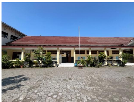
Gambar 1. Kondisi Fisik SDN Sumber 1 Surakarta

Memperkenalkan gaya hidup berkelanjutan sejak dini semakin penting sebagai upaya membentuk generasi yang peduli lingkungan dan berkarakter kuat di tengah tantangan globalisasi (Nuringsih et al., 2024). SDN Sumber 1 Surakarta adalah sekolah dasar negeri dengan lebih dari 100 siswa dari beragam latar belakang sosial ekonomi dan terletak di wilayah dengan kepadatan penduduk yang cukup tinggi serta akses lingkungan yang memadai, sehingga berpotensi dikembangkan untuk pendidikan berbasis aksi nyata. Sasaran kegiatan ini adalah siswa sekolah dasar kelas 4 hingga 6, berusia 10–12 tahun, yang sedang berada dalam fase perkembangan di mana mereka semakin aktif, responsif, dan menunjukkan kemampuan kognitif yang mulai berkembang dari tingkat dasar hingga menengah. Pada usia ini, mereka umumnya memiliki rasa ingin tahu dan antusiasme yang tinggi untuk mengeksplorasi pengalaman baru di luar pembelajaran formal, sehingga memiliki potensi besar untuk terlibat dalam kegiatan pendidikan yang aplikatif dan bermakna (Fauziah & Fatayan, 2025).