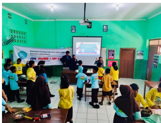
Gambar 6. Diskusi dan Tanya Jawab

Tahap refleksi ditunjukkan melalui diskusi terbuka dengan peserta dan guru, yang menyoroti perubahan perilaku dan motivasi dalam menerapkan pemanfaatan sampah di rumah dan di lingkungan sekolah. Wawancara singkat pasca pelatihan mengungkapkan bahwa lebih dari 70% peserta merasa terinspirasi untuk mencoba produk serupa secara mandiri dan menyadari pentingnya inovasi berbasis lingkungan. Guru pendamping juga melaporkan peningkatan semangat kerja sama dan kepercayaan diri siswa setelah berpartisipasi dalam seluruh rangkaian kegiatan. Beberapa peserta bahkan mulai menginspirasi teman-teman mereka untuk mendaur ulang sampah dapur menjadi produk bermanfaat lainnya. Secara keseluruhan, fase evaluasi dan refleksi menegaskan keberhasilan program pengabdian masyarakat melalui perubahan positif dalam pengetahuan, keterampilan, dan perilaku siswa.