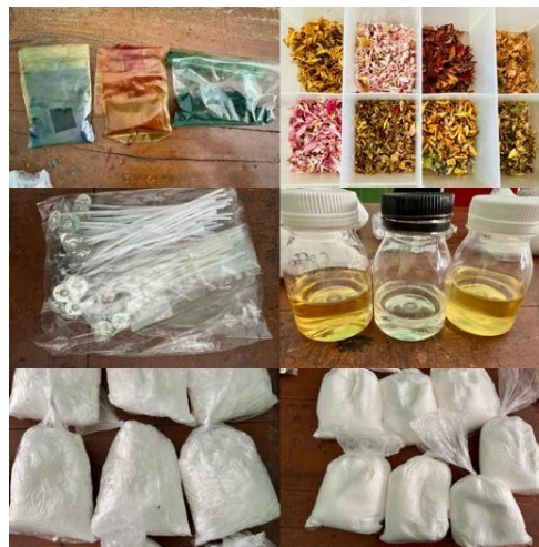
Gambar 2. Persiapan Bahan - Bahan Pembuatan Lilin Aromaterapi

Selain persiapan materi, tahap persiapan meliputi intensifikasi koordinasi dengan pihak sekolah dan komite untuk memastikan kegiatan dapat dilaksanakan secara terintegrasi dalam program sekolah berbasis lingkungan hidup. Diskusi dengan guru menghasilkan jadwal pelatihan yang tidak mengganggu jam belajar serta pemanfaatan ruang serbaguna untuk praktik pembuatan lilin aromaterapi. Seluruh alat dan bahan, seperti minyak nabati bekas, minyak atsiri lokal, limbah bunga dan sumbu lilin, dipersiapkan bersama agar peserta mudah memahami konsep pemanfaatan sumber daya domestik secara berkelanjutan. Sosialisasi awal kepada peserta dilakukan dengan pemutaran video inspiratif dan diskusi kelompok untuk membangun motivasi serta pemahaman terhadap pentingnya inovasi berbasis limbah. Persiapan yang matang pada tahap awal terbukti memberikan landasan yang kuat bagi keberhasilan pelaksanaan program yang efektif dan partisipatif (Sulistiyono et al., 2023).