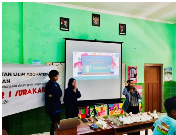
Gambar 3. Penyampaian Materi Edukasi Pembuatan Lilin Aromaterapi

menggunakan media visual dan studi kasus sederhana untuk mendukung pemahaman peserta tentang pentingnya pemanfaatan limbah dapur, khususnya minyak goreng bekas, sebagai bahan baku lilin aromaterapi. Hasil observasi menunjukkan adanya peningkatan perhatian dan rasa ingin tahu peserta selama sesi edukasi, dengan 88% peserta aktif bertanya dan berpartisipasi dalam diskusi kelompok. Setelah pelatihan, dilakukan uji coba singkat, yang menunjukkan bahwa sebagian besar peserta masih awam dengan konsep ini dan membutuhkan bimbingan lebih lanjut. Pendekatan edukasi ini secara efektif membuka wawasan baru tentang inovasi produk ramah lingkungan dan penerapannya dalam kehidupan sehari-hari (Widhiastuti et al., 2023).