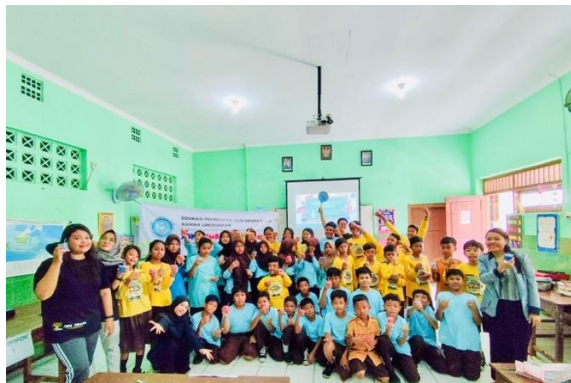
Gambar 7. Foto Bersama Peserta Pelatihan Pembuatan Lilin Aromaterapi

Kebersamaan dan antusiasme seluruh peserta, sebagaimana terekam dalam dokumentasi pelatihan, menjadi bukti nyata keberhasilan program dalam menumbuhkan semangat kolaborasi, kemandirian, dan pemahaman praktis tentang pengolahan sampah menjadi lilin aromaterapi yang bermanfaat. Suasana positif di dalam kelas tidak hanya mencerminkan peningkatan pengetahuan dan keterampilan, tetapi juga memperkuat nilai-nilai karakter dan kepedulian lingkungan di lingkungan sekolah. Dukungan aktif dari guru, fasilitator, dan siswa selama proses pendidikan menegaskan bahwa sinergi antar semua pihak merupakan kunci tercapainya tujuan pengabdian masyarakat yang berkelanjutan. Dengan demikian, pelatihan ini tidak hanya menghasilkan produk, tetapi juga menanamkan inspirasi gaya hidup berkelanjutan dan gotong royong di kalangan generasi muda. Dokumentasi visual pelaksanaan pelatihan menjadi bagian penting dalam memperkuat narasi keberhasilan dan memberikan motivasi bagi pengembangan program ke depan.