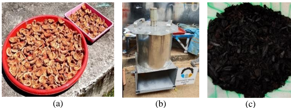
Gambar 3. (a) pengeringan bahan baku utama; (b) pirolisis bahan baku dan (c) arang tempurung nipah dan kelapa

Gambar 2. Sosialisasi Persiapan Pelatihan Dan Pendampingan Tim Pengabdi Dengan Mitra Selanjutnya dilakukan praktik langsung pembuatan biobriket yang ramah lingkungan, mulai dari proses pembakaran tempurung nipah dan batok kelapa hingga menghasilkan arang, lalu dihaluskan dengan menggunakan media penumbuk manual, dilanjut dengan proses penyaringan arang halus lalu pencampuran bahan seperti bubuk arang batok kelapa, tepung kanji, dan air. Setelah melakukan pencampuran dilakukan proses pencetakan dengan menggunakan alat cetak berkapasitas 15 kotak yang sudah dibuat dari stainless steel, ketika semua bahan sudah tercampur rata maka dimasukkan ke dalam cetakan sampai benar-benar padat lalu dikeluarkan secara perlahan hingga menghasilkan briket berbentuk persegi (kotak). Setelah itu dilakukan proses penjemuran briket yang sudah dicetak sebelumnya di bawah sinar matahari langsung hingga benar-benar kering. Kemudian dilakukan tes uji nyala briket sekaligus mengevaluasi program yang sudah dijalankan. Berikut ini Gambar 3 menunjukkan proses pembuatan biobriket Tim Pengabdi dengan mitra kegiatan dan Gambar 4 menunjukkan proses pencetakan dan hasil akhir produk Biobriket.