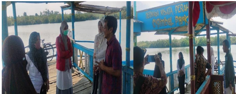
Gambar 1. Sosialisasi Program Kegiatan

Program pelaksanaan kegiatan pengabdian masyarakat diselenggarakan pada tanggal 6 November 2025 yang berlokasi di Pendopo Kompleks Wisata Cigimbal Park Kelurahan Tritih Kulon. Pelaksanaan kegiatan program pengabdian ini diawali dengan pemaparan program kerja yang berupa sosialisasi penyampaian kegiatan apa saja yang akan dilakukan selama kurang lebih dua bulan di Kelurahan Tritih Kulon termasuk rencana akan mengadakan pelatihan dan pendampingan pembuatan biobriket tempurung nipah dan batok kelapa. Berikut ini Gambar 1 menunjukkan kegiatan sosialisasi program.