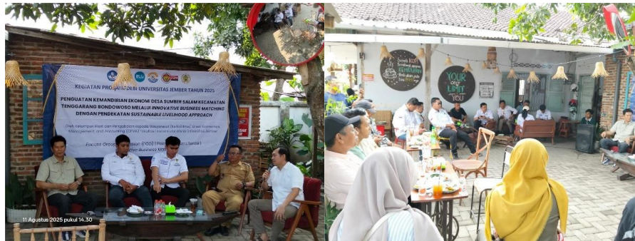
Gambar 3. Kegiatan innovative business matching antara UMKM lokal di Desa Sumber Salam

transparansi, mempermudah akses informasi publik, dan mendukung pertumbuhan ekonomi lokal dengan mempromosikan potensi desa, seperti produk unggulan dan pariwisata. Website juga membantu warga mengakses layanan publik secara online, mengatasi kendala jarak dan waktu, serta memungkinkan pemerintah desa berkomunikasi langsung dengan masyarakat untuk mendorong keterlibatan warga dalam pembangunan desa.