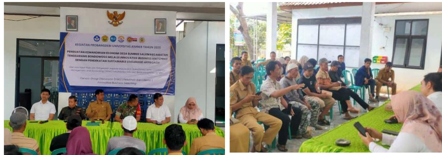
Gambar 2. Kegiatan focuss group discussion (FGD) dengan pendekatan participatory rural appraisal (PRA)

masyarakat dengan keahliannya masing-masing kelak dapat dimanfaatkan apabila dibutuhkan fasilitator kegiatan tertentu maupun penggerak kegiatan yang ada pada komunitas masyarakat. Pelibatan berbagai golongan masyarakat dalam FGD dan penilaian PRA diharapkan dapat memberikan gambaran dan masukan yang komprehensif dalam merumuskan model penguatan kemandirian desa dengan pendekatan SLA.