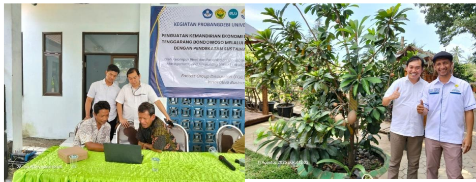
Gambar 4. Kegiatan coaching clinic dan pendampingan terhadap UMKM lokal di Desa Sumber Salam

Setelah peserta terdaftar, tahap diagnosis dan perencanaan individual dilakukan. Pada fase ini, setiap peserta UMKM menjalani sesi konsultasi one-on-one dengan coach untuk menganalisis kekuatan, kelemahan, peluang, dan ancaman (SWOT) usahanya secara mendalam. Coach kemudian membantu menyusun rencana aksi yang realistis dan terukur, misalnya dengan menetapkan target penjualan, strategi penetapan harga, atau perbaikan kualitas produk. Tahap ini sangat krusial karena memastikan bahwa bimbingan yang diberikan benar-benar sesuai dengan konteks dan kapasitas masing-masing usaha, sehingga tidak terjadi pendekatan yang seragam untuk semua UMKM.