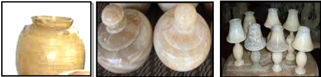
Gambar 1. Hasil karya kerajinan guci, kendi air, lampu hias yang berasal dari bahan baku batu bintang