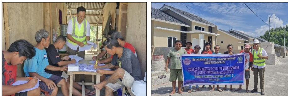
Gambar 2. Pelaksanaan Pelatihan dan Pendampingan

Setelah pelatihan, seluruh pekerja memahami bahwa sabuk pengaman wajib digunakan pada pekerjaan di ketinggian. Hal ini sesuai dengan PP No. 50 Tahun 2012 tentang Sistem Manajemen K3. Banyak pekerja tidak menyadari risiko bahan kimia dan kebocoran air. Setelah pendampingan, pemahaman meningkat signifikan meskipun masih ada 1 pekerja yang belum tepat menjawab. Hal ini menunjukkan perlunya simulasi tambahan pada pekerjaan MEP ( mechanical, electrical, plumbing ). Pekerja sudah cukup paham sejak awal, namun pelatihan memastikan 100 % pekerja memahami penggunaan masker, kacamata dan ear plug .