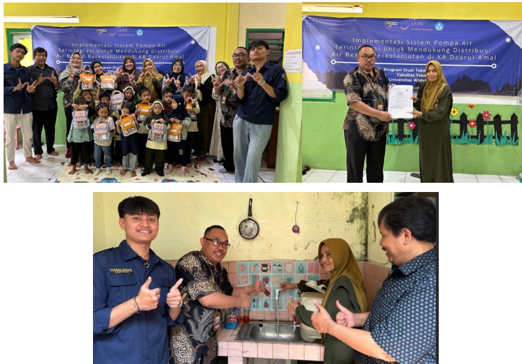
Gambar 2. Pelatihan teknis dan kegiatan edukatif bagi para siswa KOBER Daarul Amal