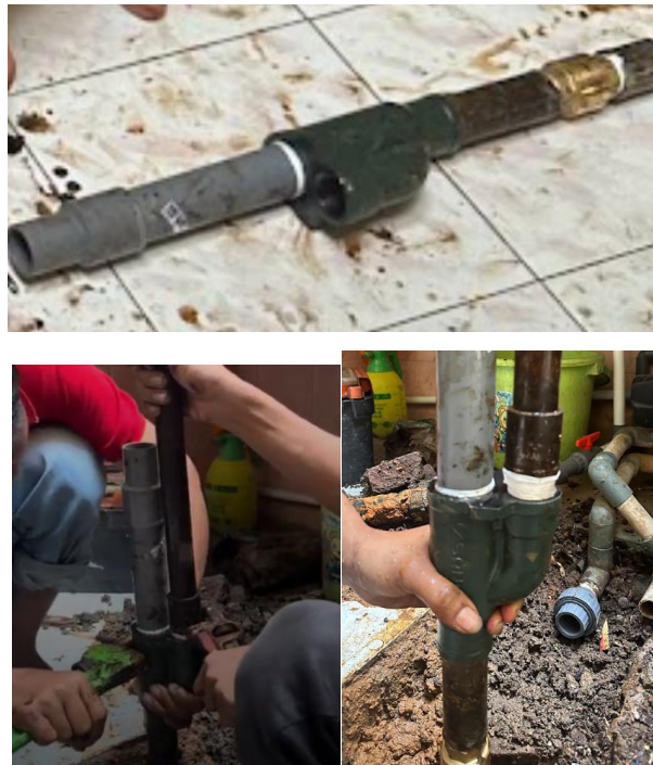
Gambar 4. Proses perbaikan dan penggantian komponen pompa.

Kegiatan perbaikan dan penggantian komponen dilaksanakan secara kolaboratif oleh mahasiswa, dosen, dan teknisi sebagai wujud penerapan kompetensi yang diperoleh melalui proses pembelajaran di lingkungan perguruan tinggi. Proses perbaikan dan penggantian dapat dilihat pada Gambar 4.