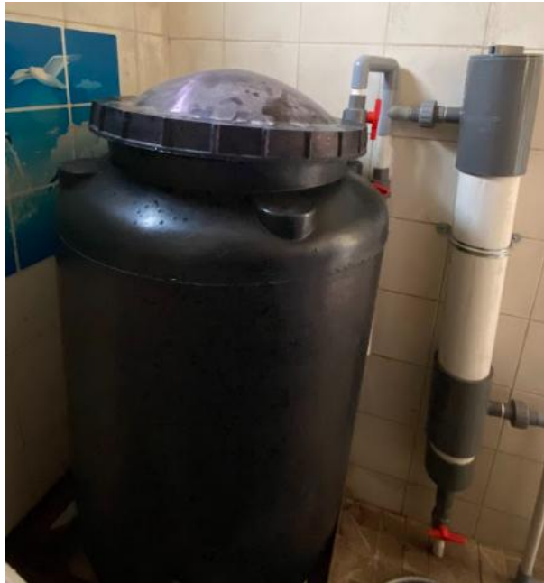
Gambar 1. Sistem filtrasi air di Kelompok bermain (KOBER) Daarul Amal(Sofia et al., 2025).