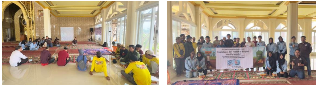
Gambar 2. Sosialisasi Program Pengabdian kepada Masyarakat di RW 18 Desa Rancamanyar