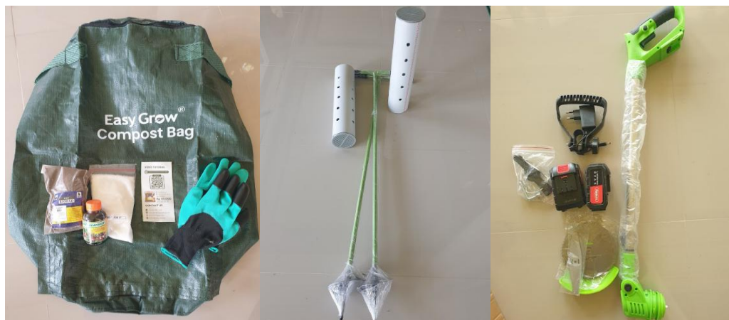
Gambar 3. Peralatan Lubang Biopori dan Komposter Rumah Tangga