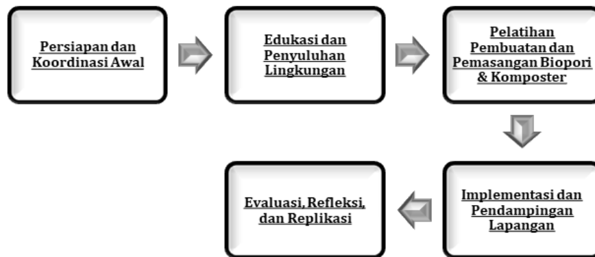
Gambar 1. Metodologi Pelaksanaan PKM

Solusi yang ditawarkan kepada mitra adalah pendekatan terpadu yang terdiri dari edukasi, pelatihan, dan pendampingan teknis berbasis teknologi tepat guna. Solusi yang dirancang mencakup aspek pengetahuan, keterampilan, hingga pembentukan kebiasaan ekologis di lingkungan rumah tangga. Teknologi Tepat Guna akan efektif jika diterapkan melalui pendekatan integratif, meliputi edukasi konseptual, pelatihan praktis, serta pendampingan berkelanjutan untuk menjamin adopsi teknologi di tingkat pengguna akhir (Sudarsono, 2020, Teknologi dan Pemberdayaan Masyarakat , Penerbit Andi). Dalam kegiatan ini diberikan juga kuesioner pretest dan posttest sebagai evaluasi bagi tim yang bertujuan untuk membandingkan tujuan yang diharapkan dengan kemajuan yang telah dicapai (Magdalena et.al., 2021).