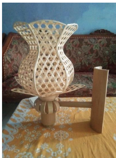
Gambar 1. Produk yang akan dipasarkan secara online

Pada program pengenalan produk anyaman bambu sesuai dengan hasil tabel di atas, yaitu pendampingan pembuatan poster guna di peruntukan pemasaran di media sosial. Pada awalnya mengenalkan aplikasi canva dan corel draw untuk membuat poster anyaman bambu namun karena keterbatasan laptop atau pc pada akhirnya menggunakan aplikasi canva untuk membuat poster karena dari sasaran sendiri lebih mudah dan mengerti jika menggunakan canva . Setelah saya dan bersama sasaran membuat poster kemudian saya membiarkan sasaran untuk mengoprasikan aplikasi tersebut untuk membuat poster sendiri yang sesuai dengan sasaran inginkan meski masih tidak lancer tapi bisa dianggap sasaran bisa melakukannya dan berikut adalah hasil poster pembuatan dari sasaran.