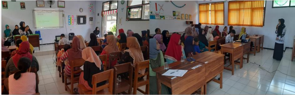
Gambar 7. Sosialisasi SIM bagi Wali Murid Kelas 7, 8, dan 9

pada sistem. Hingga laporan ini dibuat, guru-guru SMPN Satap 4 Panarukan menggunakan SIM dengan baik. Namun sayangnya, sedikit sekali orangtua siswa yang terdata menggunakan Telegram sehingga program koordinasi antara sekolah dan wali murid tidak dapat dilaksanakan dengan maksimal.