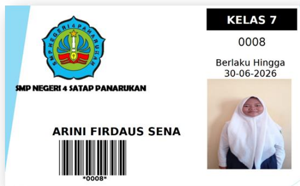
Gambar 8. Contoh Kartu Keanggotaan Perpustakaan SMPN Satap 4 Panarukan yang Dicitak dari INLISlite

Tujuan tim pelaksana memodifikasi aplikasi INLISlite sekolah adalah supaya siswa dapat mengakses perpustakaan di manapun dan kapanpun mereka berada. Hal ini tentu saja bertujuan untuk meningkatkan minat baca siswa. Namun, dikarenakan tidak adanya akses untuk memodifikasi fitur INLISlite milik sekolah, tanpa harus menghilangkan tujuan awal, tim pelaksana menyediakan e-library yang terintegrasi dalam website sekolah. Di e-library ini telah tersedia ratusan buku dari berbagai genre yang bisa dibaca ataupun didownload oleh siswa maupun guru. Dengan kata lain, pengadaan e-library ini merupakan salah satu alternatif untuk memberikan kesempatan dan akses yang lebih bagi siswa untuk membaca. Tautan untuk e-library jika diklik akan menuju sebuah drive bersama yang memuat koleksi buku yang dapat dibaca oleh siapapun. Penambahan koleksi buku di e-library akan terus dilakukan oleh tim pelaksana sebagai salah satu bentuk keberlanjutan kegiatan di SMP Negeri Satap 4 Panarukan.