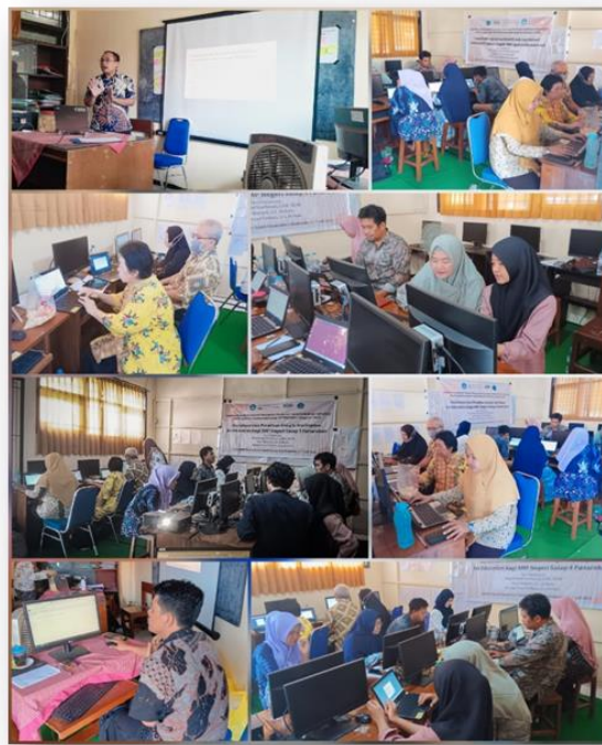
Gambar 1. Dokumentasi Kegiatan Sosialisasi Sekolah Digital dan Pengenalan Google Workspace for Education

2. Kegiatan kedua yang dilaksanakan adalah pelatihan penggunaan Google Workspace for Education. Kegiatan ini dibagi menjadi dua pertemuan. Pertemuan pertama dilaksanakan pada Jumat, 7 Juli 2023 dan 11 Juli 2023 dari pukul 09:30 – 14:00 WIB dan dihadiri oleh kepala sekolah dan semua guru. Pada kegiatan ini, terdapat beberapa materi yang diberikan yaitu: