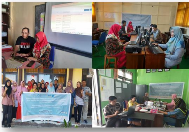
Gambar 3. Dokumentasi Kegiatan Ujian GCE Level 1

4 Panarukan. Ujian ini adalah bentuk validasi atas keterampilan guru-guru dalam menggunakan fitur-fitur Google untuk diterapkan dalam proses pembelajaran di sekolah. Sebelum ujian dimulai, narasumber memberikan pendampingan dalam proses claim voucher ujian hingga tahap siap ujian. Dikarenakan terbatasnya waktu yang ada dan sinyal yang tidak stabil, ujian dilaksanakan secara bertahap dari tanggal 4 – 11 Agustus 2023. Ujian dapat dikerjakan di sekolah atau rumah masing-masing agar pelaksanaan ujian lebih tenang dan lancar. Hingga saat laporan ini dibuat, dari dua belas orang guru peserta GCE Level 1, empat orang berhasil lulus dan tersertifikasi sebagai Google Certified Educator Level 1. Ini artinya, SMPN Satap 4 Panarukan telah melewati jumlah minimal guru yang ditargetkan lulus yaitu tiga orang.