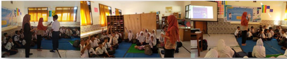
Gambar 4. Dokumentasi Sosialisasi Literasi Digital bagi Siswa

berpikir kritis dalam penggunaan teknologi. Pada saat sosialisasi, siswa menerima kuesioner tentang literasi digital yang berisi beberapa pertanyaan