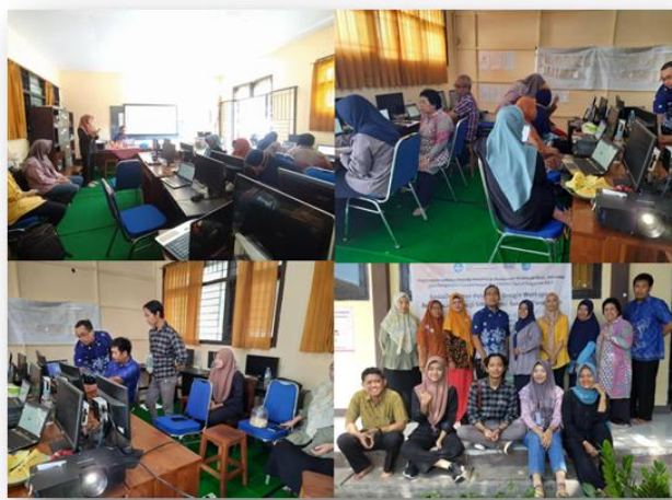
Gambar 2. Dokumentasi Kegiatan Pelatihan 1 Google Workspace for Education

Pada pertemuan ini terdapat tiga penugasan bagi guru yaitu praktik penggunaan Google Slides, praktik penggunaan Google Keep, praktik penggunaan Google Task, dan praktik penggunaan Google Meet.