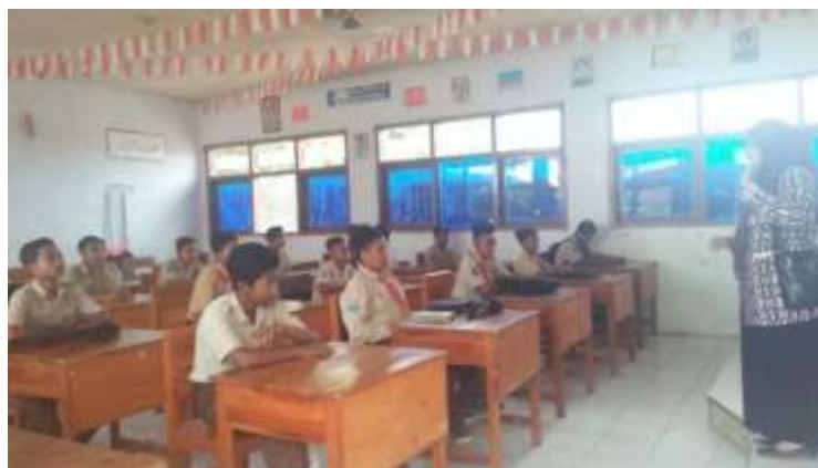
Gambar 4. Memberikan pengenalan materi

Pada pelatihan pertemuan pertama dikenalkan trik metode predicting dan scanning kepada siswa untuk menjawab soal pilihan di ujian nasional. Kemudian dilanjutkan dengan mencoba berlatih menjawab 10 soal ujian nasional yang terdapat pada lembar kerja siswa yang mereka miliki. Pada pertemuan pertama ini siswa masih kebingungan dalam menjawab soal-soal. Pembahasan dilakukan dengan menggunakan trik menjawab predicting dan scanning . Kemudian siswa diminta melanjutkan lagi mengerjakan 10 soal lanjutan seperti yang telah dicontohkan. Dari hasil pembahasan siswa mulai mengerti bagaimana cara menjawab soal dengan cepat dan tepat. Mereka tampak senang dan memberi tanggapan ternyata menjawab soal bahasa Inggris tidak sesulit yang mereka anggap selama ini.