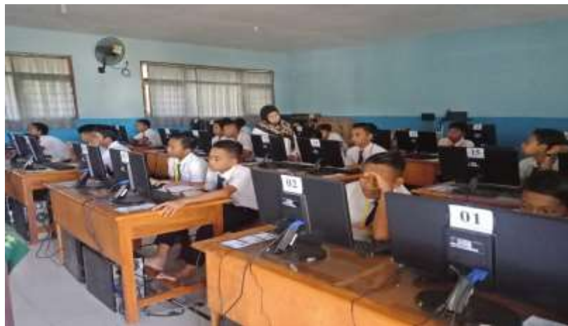
Gambar 5. Kegiatan Posttest

Dari hasil posttest di temukan bahwa sekitar 60% siswa dari total 70 siswa sudah mencapai nilai rata-rata yang diharapkan yaitu minimal 60. Sedangkan 40% mahasiswa masih dibawah nilai yang diharapkan. Namun mereka sudah mulai paham bagaimana trik cara menjawab soal jika mereka tidak mengerti sekali dengan soal yang dimaksud.