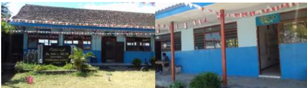
Gambar 1: Visualisasi MTS Nurul Hikam Kapongan

Visualisasi MTS Nurul Hikam dapat dilihat dari gambar-gambar berikut: