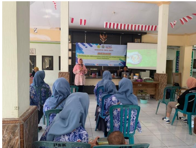
Gambar 2 Proses Penyampaian Materi

Penyampaian materi pembuatan pupuk organik dilakukan dengan metode ceramah menggunakan power point. Fokus penyampaian materi adalah agar petani dan ibu-ibu kader Desa Tegalrejo mengetahui teori dasar terkait dengan cara pembuatan pupuk organik sebelum demonstrasi pembuatan MOL. Penyampaian materi penyuluhan dilaksanakan dengan durasi 15 menit. Setelah penyampaian materi maka dibuka sesi diskusi tanya jawab dari peserta penyuluhan dengan pemateri.