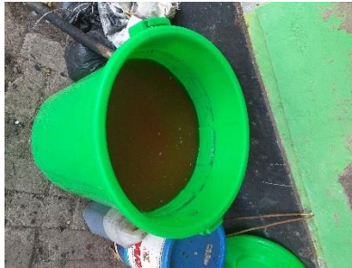
Gambar 4: Proses pembuatan MOL (Mikro-Organisme Lokal)

MOL (Mikro-Organisme Lokal) adalah hasil dari bahan yang dari sumberdaya yang tersedia dilingkungan sekitar. MOL (Mikro-Organisme Lokal) mempunyai kandungan unsur hara makro dan mikro dan juga mengandung bakteri yang memiliki potensi sebagai perombak bahan organik, perangsang pertumbuhan dan sebagai agensi hayati dan pengusir penyakit tanaman.