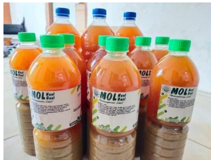
Gambar 5 Hasil Fermentasi MOL (Mikro-Organisme Lokal) Nasibasi

MOL (Mikro-Organisme Lokal) memiliki kandungan unsur hara makro dan mikro yang merupakan salah satu jenis pupuk cair dengan banyak sekali manfaatnya, karena dapat berperan penting dalam budidaya pertanian organik. Bahan utama Mol (Mikro-Organisme Lokal) terdiri dari komponen, yaitu karbohidrat, glukosa dan sumber mikroorganisme (Ismaya dan Parawansa, 2014).