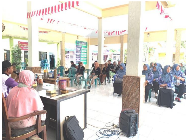
Gambar 3: Proses Diskusi Bersama Peserta Penyuluhan