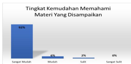
Gambar 5. Tingkat Kemudahan Memahami Materi Yang Disampaikan

Gambar 4. Menjelaskan terkait dengan kemudahan dalam mengoperasikan Zotero. Pada kegiatan pelatihan telah dilaksanakan kegiatan praktek dan juga pendampingan. Tujuan adanya kegiatan praktek dan pendampingan agar mahasiswa himpunan mahasiswa jombang di Jember-Banyuwangi lebih mudah dan mahir dalam mengelola referensi menggunakan aplikasi Zotero. Kegiatan ini berlangsung sangat lama yakni dengan durasi 6 jam mengingat pada saat kegiatan berlangsung setiap peserta mendapatkan kesempatan untuk mensimulasikan secara langsung Zotero mulai dari input referensi sampai dengan daftar pustaka. Berdasarkan hasil penyebaran kuesioner yang dilakukan menunjukkan bahwa mahasiswa menyatakan bahwa mahasiswa mudah dalam mengoperasikan aplikasi Zotero dalam mengelola referensi terbukti dengan prosentase yang sangat tinggi yakni 89%. Selain itu tidak peserta yang menganggap bahwa mengoperasikan aplikasi Zotero sangat sulit (0%).