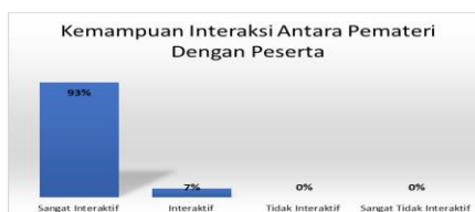
Gambar 7. Kemampuan Interaksi Antara Pemateri Dengan Peserta

Pemateri yang diundang dalam acara pelatihan pengelolaan referensi dengan menggunakan aplikasi Zotero merupakan pemateri yang telah memiliki rekam jejak yang baik berkaitan dengan penulisan karya tulis ilmiah. Pemateri yang memiliki kompetensi dapat menyampaikan materi dengan baik dan mudah dipahami oleh peserta serta muatan materi yang disajikan menjadi lebih lugas. Gambar 6 menunjukkan bahwa peserta setuju bahwa pemateri yang diundang memiliki kompetensi yang tinggi dalam memberikan pelatihan pengelolaan referensi ini dengan prosentase 87%.