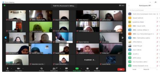
Gambar 7. Foto Bersama Peserta