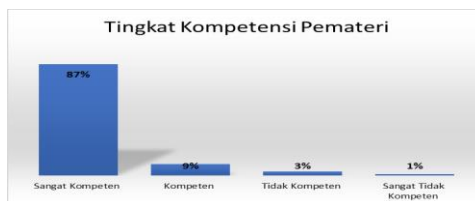
Gambar 6. Tingkat Kompetensi Pemateri

dengan prosentase 92% sangat mudah memahami materi yang disampaikan dan peserta bisa menyerap dengan baik ilmu yang diberikan oleh kedua pemateri.