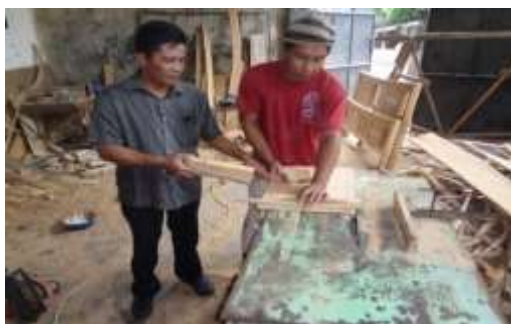
Gambar 1. Proses Pembuatan Meja Dari Limbah Potongan Kayu

Dari kegiatan ini tercapai target luaran berupa produk serta adanya peningkatan pemahaman dan keterampilan masyarakat mitra seperti terlihat pada gambar 2