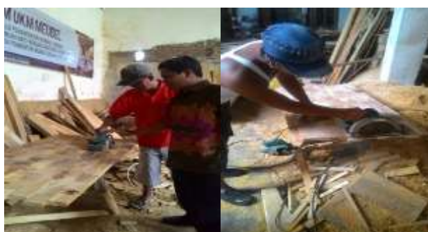
Gambar 2. Proses Pembuatan Meja dari Limbah Potongan Kayu

Dari kegiatan ini tercapai target luaran berupa produk serta adanya peningkatan pemahaman dan keterampilan masyarakat mitra seperti terlihat pada gambar 2