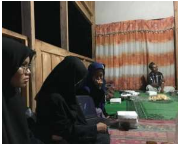
Gambar 6. Sosialisasi Manajemen Usaha