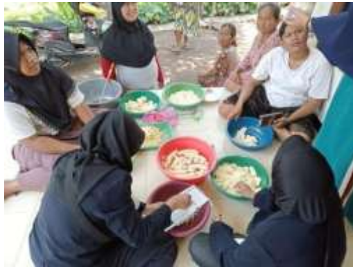
Gambar 1. Sosialisasi dan Pelatihan Pembuatan Muffin Pisang

Di akhir acara sosialisasi dan pelatihan, peserta dapat mencoba muffin pisang yang telah dibuat bersama-sama. Selain itu, tim pengusul juga memberikan catatan resep beserta SOP pembuatan muffin yang dibagikan kepada peserta.