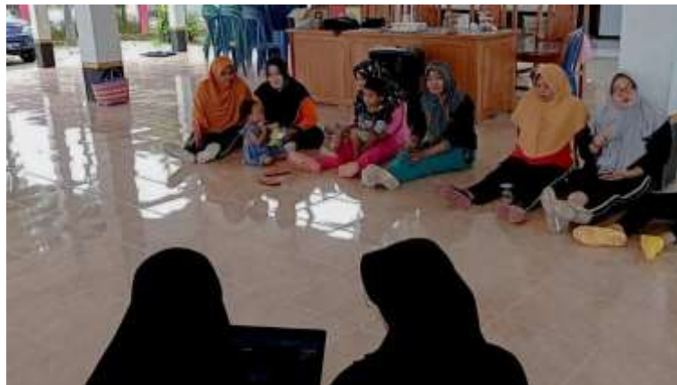
Gambar 2. Sosialisasi Strategi Pemasaran

presentasi yang dijelaskan. Maka dari itu, metode ini dianggap lebih efektif untuk menyampaikan edukasi atau pengetahuan mengenai pemasaran produk.