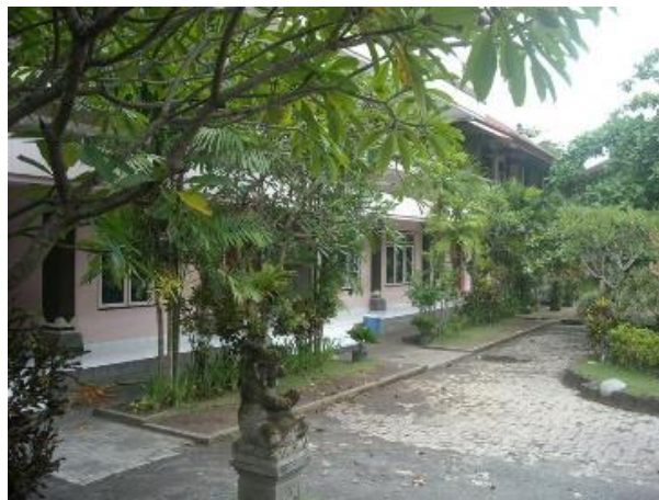
Gambar 2. Bangunan Kelas

Dari permasalahan diatas, melalui kegiatan pengabdian ini dilakukan suatu pembicaraan dengan mitra mengenai solusi dari permasalahan. Untuk solusi yang di prioritaskan dan disepakati oleh mitra tersebut adalah memberikan pelatihan tentang pembuatan media pembelajaran dengan aplikasi Canva untuk lebih membantu proses belajar siswa SD sehingga tidak mengalami kejenuhan dalam penyerapan materi belajar. Penerapan media pembelajaran Canva dinyatakan