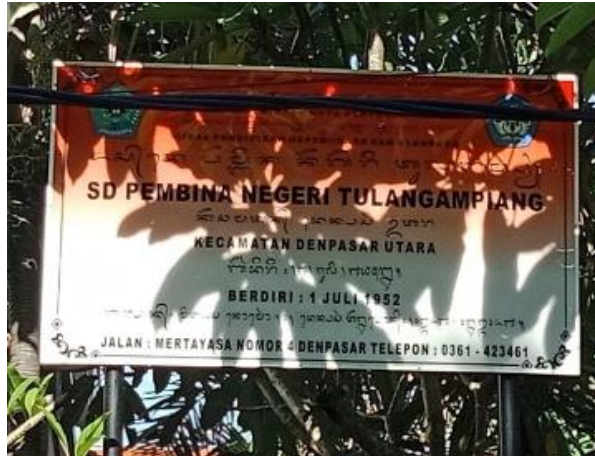
Gambar 1. Papan Nama SDN Tulangampiang

Adapun situasi tempat kerja mitra seperti terlihat pada gambar 1 dan gambar 2.