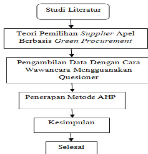
Gambar 2. Kerangka Konsep Penelitian

Kerangka konsep penelitian pada pemilihan supplier apel berbasis green procurement dengan metode AHP dapat dilihat pada Gambar 2.