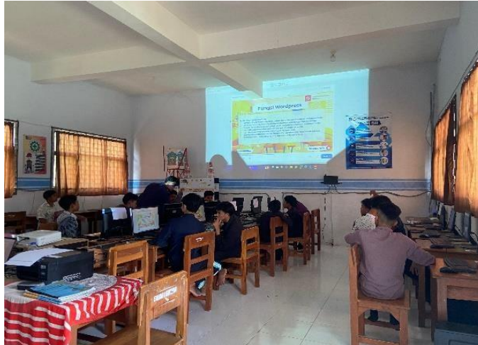
Gambar 1. Dokumentasi Pelaksanaan Kegiatan Pengabdian

dan blog. Dan dilakukan evaluasi melalui peninjauan hasil yang sudah dibuat oleh siswa (Nalendra et al., 2022).